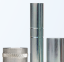
Limitadores de compresión