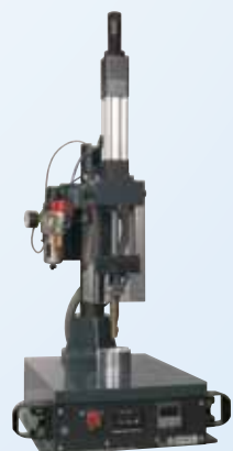
Tecnología de instalación de insertos