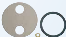
Arandelas de precisión