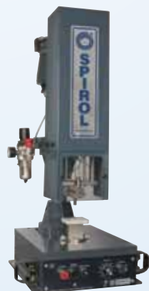
Tecnología de instalación de pasadores