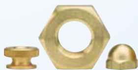
Tuerca mecanizada de precisión