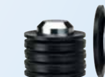
Muelles de platillo