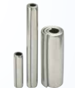
Pasadores elásticos en espiral

SPIROL Corea 160-5 Seokchon-Dong Songpa-gu, Seoul, 138-844, Corea Tel. +86 (0) 21 5046-1451 Fax. +86 (0) 21 5046-1540