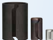
Casquillos de alineación