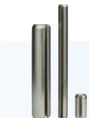
Pasadores elásticos ranurados