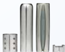
Componentes tubulares rolados