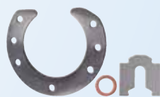
Calas de precisión y piezas finas estampadas