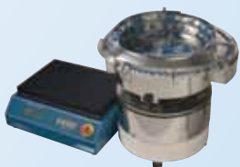
Sistemas de alimentación vibratorios

Para conocer las especificaciones actualizadas y la gama de producto estándar consulte www.SPIROL.com . Las copias impresas pueden contener información no actualizada.