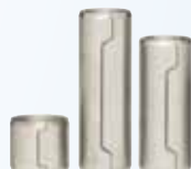
Camisas de alineación rectificadas