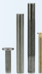
Pasadores sólidos "Drive Studs"